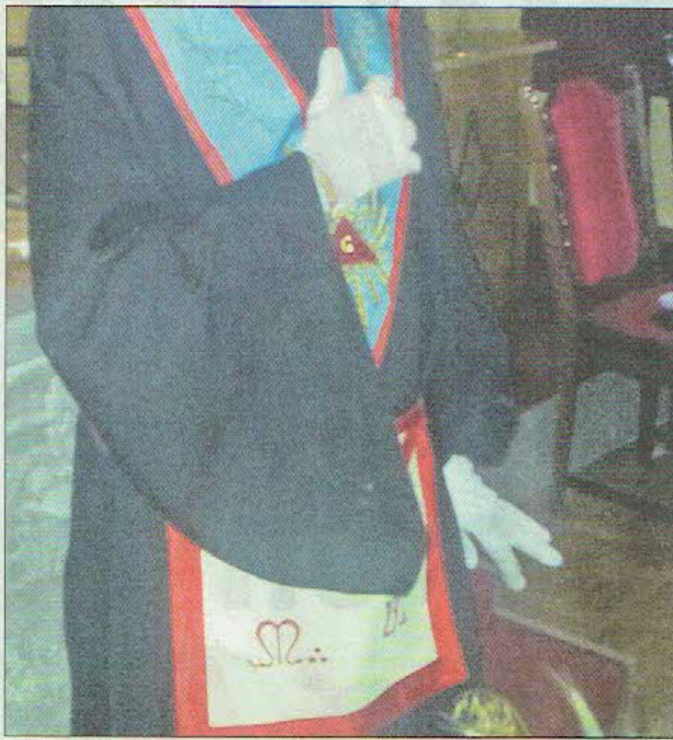
Le Vénérable Maître de la loge fribourgeoise Union et Harmonie, vêtu d'une robe noire, de gants blancs, du tablier maçonnique et du baudrier.

Le Frère «de la colonne d'harmonie» enclenche la stéréo qui diffuse différentes musiques classiques, correspondant aux paroles prononcées. Nous prenons place et nous nous laissons imprégner de l'ambiance sereine