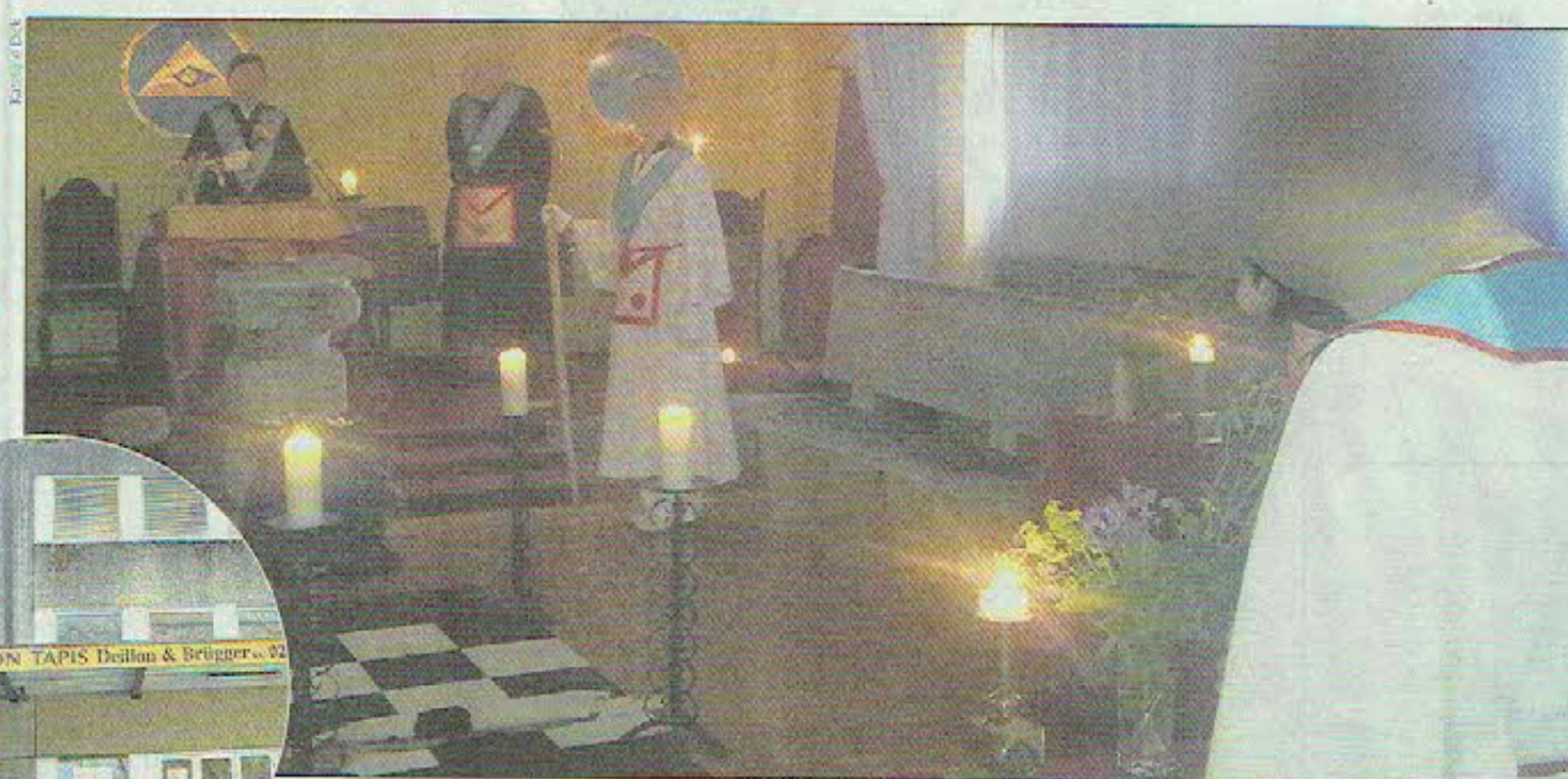
Le temple, commun aux différentes loges fribourgeoises, monté pour célébrer la Saint-Jean d'été. En médaillon, le bâtiment, Route des Neigles, à l'intérieur duquel se trouve le temple.

Une fois le parchemin brûlé et le chaudron sorti du temple, un coup de maillet tombe sur le plateau du Vénérable Maître et nous sommes invités à nous lever pour former la chaîne d'union fraternelle, pendant laquelle tous se lèvent et se donnent la main. Chacun est invité à formuler en pensée des vœux pour son développement individuel, moral et spirituel. Également des vœux pour la franc-maçonnerie universelle, des vœux pour l'universalité de la paix dans le monde. Une idée qui dépend du développement de l'individu et qui ne peut se réaliser que si chaque personne, chaque maçon crée d'abord la paix en lui. En trois temps (en levant et en abaissant trois fois les mains toujours jointes), la chaîne est d'abord ouverte, puis, une fois les vœux for-